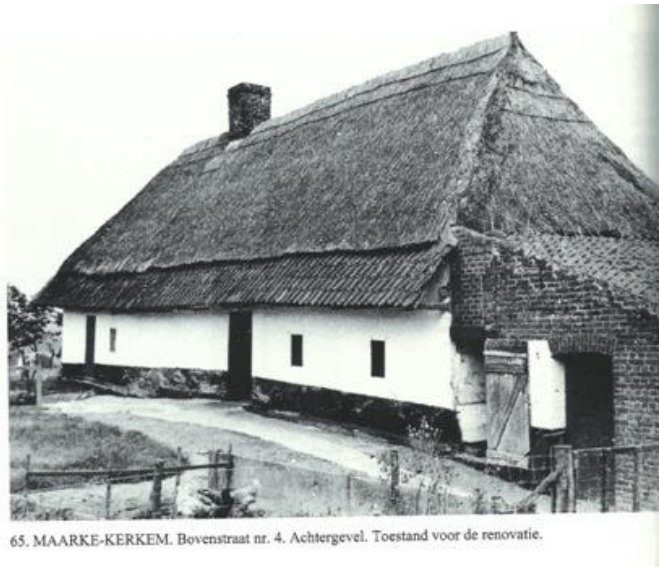
65. MAARKE-KERKEM. Bovenstraat nr. 4. Achtergevel. Toestand voor de renovatie.

C. Het genot op den berg (Bovenstraat 4). Dit voormalig boerenhuis werd vanaf 1977 gerenoveerd en sedert 1995 wordt er een restaurant uitgbaat. Voordien hout- en leembouw met strodak (zie foto). Bij de renovatie werd de originele vakwerkbouw en de dakspanten behouden. Het strodak werd vervangen door een rieten bedekking. Op de deurlatei boven de vroegere voordeur en binnen op een moerbalk staat het jaartal 1783 gegrift, waarschijnlijk verwijzend naar de bouwperiode.